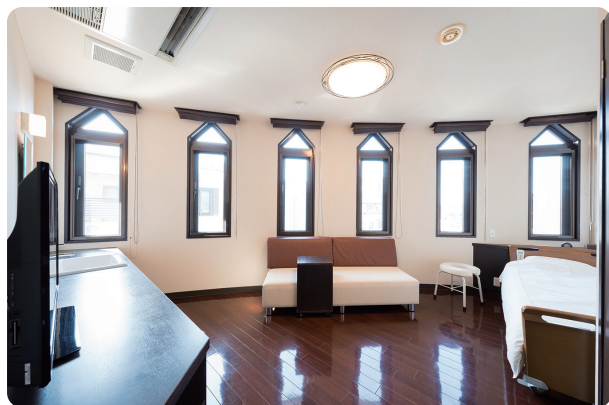
特別室シャワー・トイレ付（利用料金 +2,000円/日）