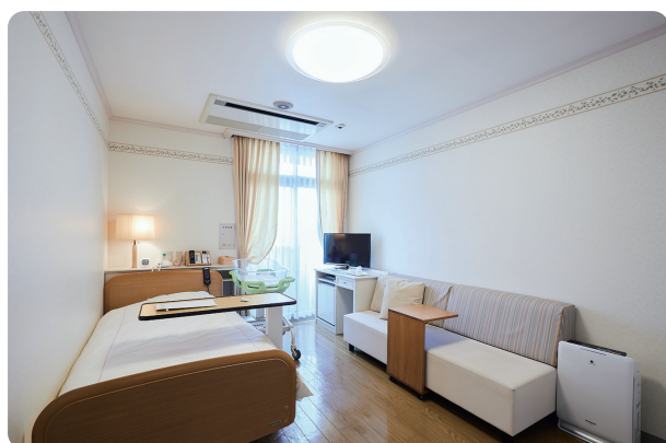
シャワー・トイレは共同利用（利用料金 +0円/日）