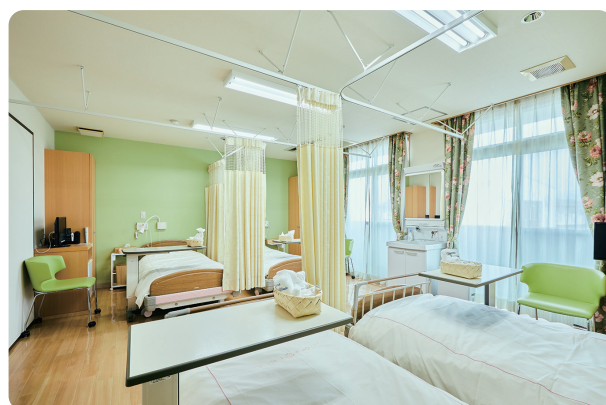
シャワー・トイレは共同利用